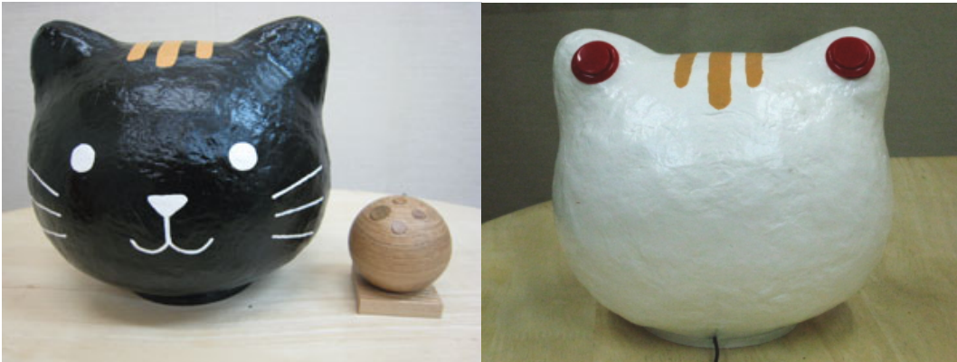
(左)Hariko デカマウス「くろーさん」と樹ビターマウス (右)しろーさん背面写真